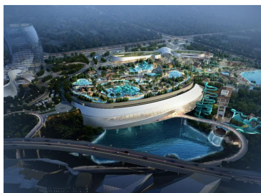
莲阳河特大桥项目