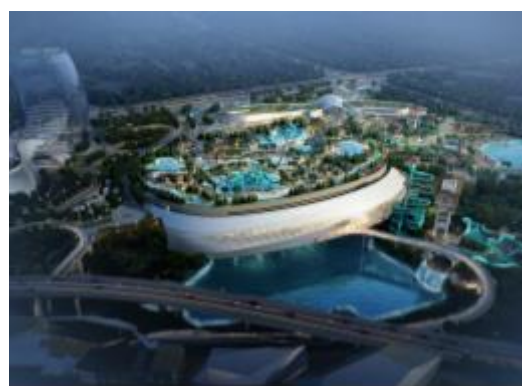
莲阳河特大桥项目