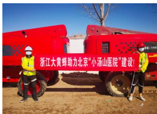
北京“小汤山”医院项目