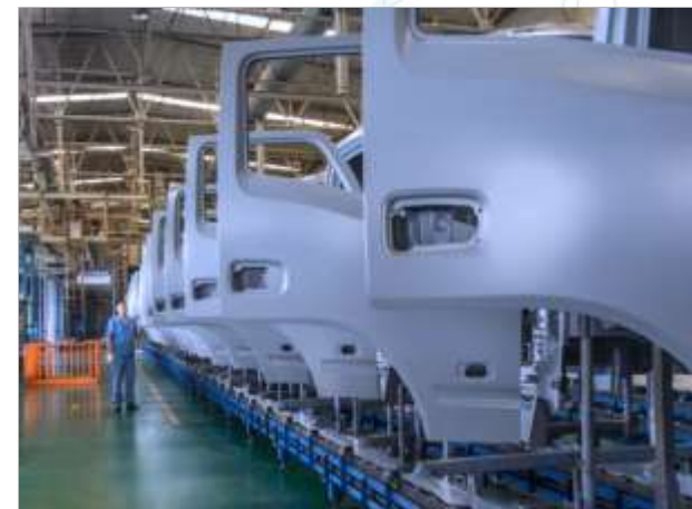
涂装 / 车间