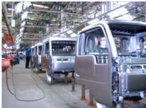
车身 / 车间