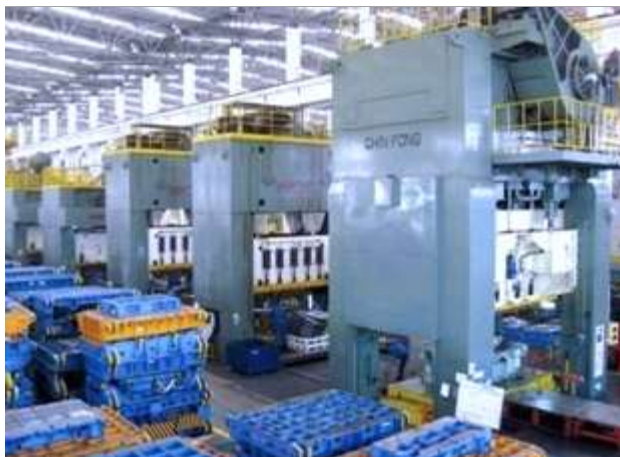
冲压 / 车间